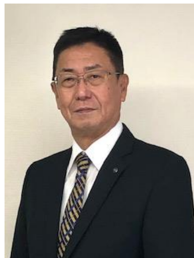
(大阪代協山中会長)