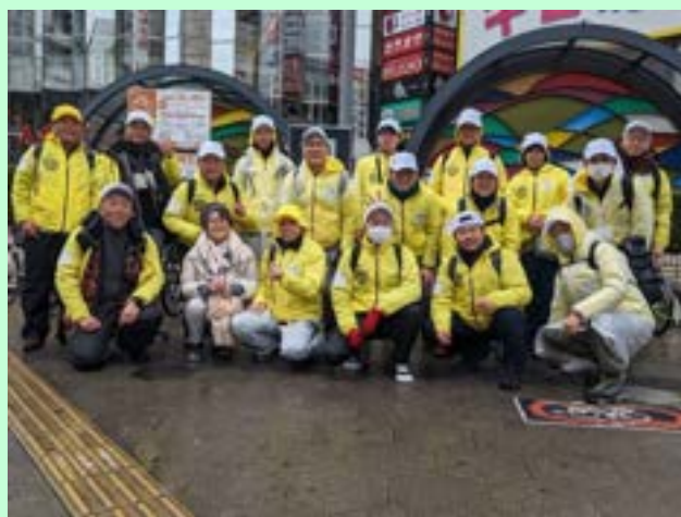
大阪マラソンボランティア