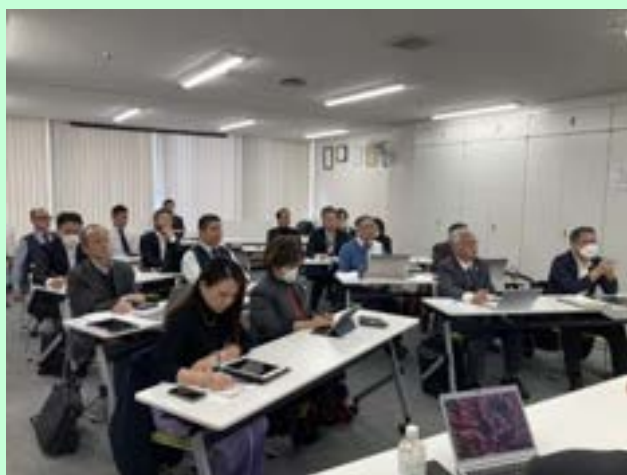
ジギョケイ認定取得ワークショップ