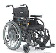
手動兼用電動車椅子