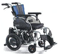
介助用電動車椅子